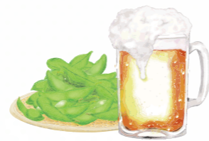
栄養科 スタッフ一同

父の日は「お父さん=ビールと初夏のつまみ」をテーマにしています。「ビール風ゼリー」はオレンジ味ベースにビールの泡に見立てたヨーグルト味のムースが乗っている渾身の力作です。病棟ダイニングでは患者さん同士で乾杯している姿が見られて患者さんだけではなく、ご家族や携わるスタッフからも笑顔がこぼれるひと時となりました。