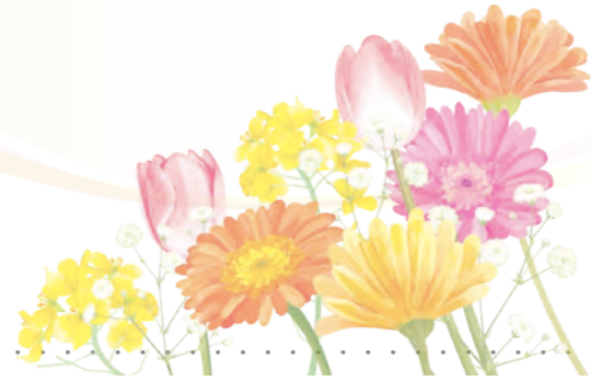
年度医療法人社団 江東リハビリテーション病院 新人歓迎会