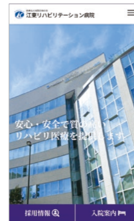
TOPページ (スマホ画面)