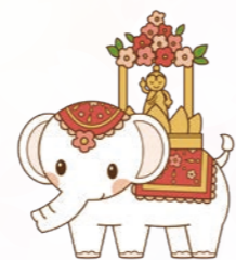
栄養科 スタッフ一同

4月8日はお釈迦様生誕の日として花まつりが催されます。咲き乱れた花をみた時の楽しい気分をメバルや筍、菜の花など春を感じさせる食材と華やかな色彩で表現してみました。桜の花が咲く季節に桜色の食事をお届けすることができ皆さんに喜んでいただけて嬉しい限りです。これからも季節の移ろいを目と舌で感じていただけるよう努力してまいります。