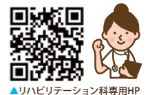
▲リハビリテーション科専用HP