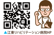
▲江東リハビリテーション病院HP