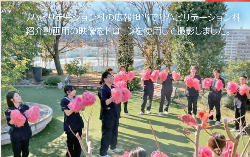
リハビリテーション科の広報担当でリハビリテーション科 紹介動画用の映像をドローンを使用して撮影しました。