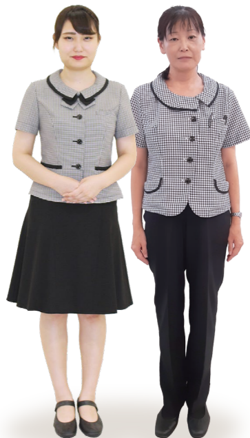
事務職員 病棟クラーク