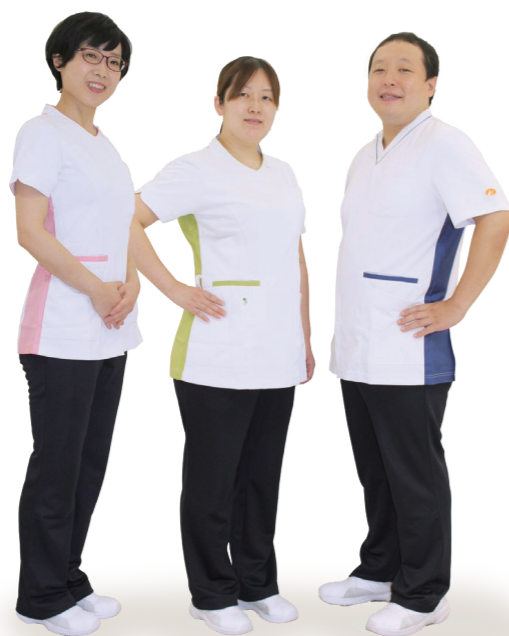
管理栄養士 薬剤師