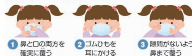
1 鼻と口の両方を確実に覆う