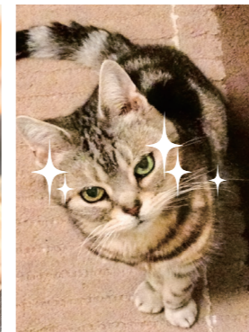
医事課 末次 ミニー