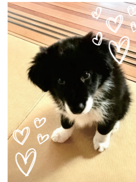
総務課 山名 ViVi