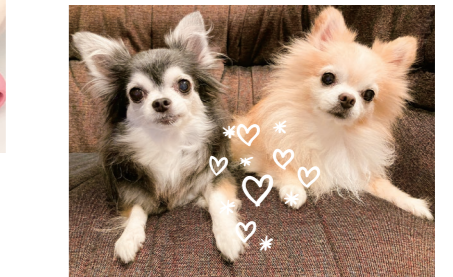
医事課 平林 チロルとアルコ