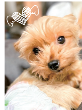
5階病棟 益田 キリマンジャロ