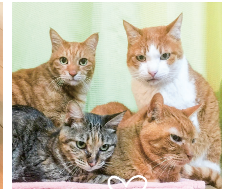
3階病棟 土屋 左上からチャップ、 パンチ、ネネ、ユートン