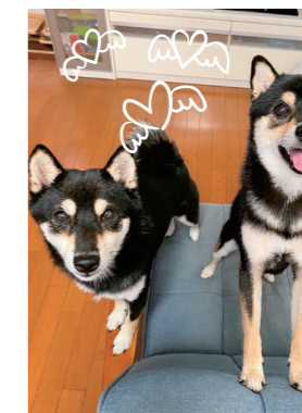
3階病棟 内田 そらと蒼