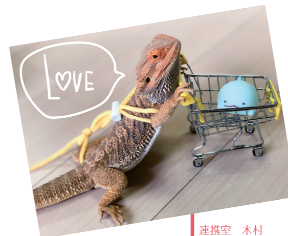
連携室 木村 はるまき