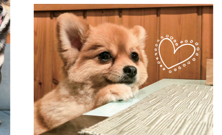
6階病棟 野澤 うに