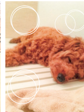
医事課 片山 シェリー