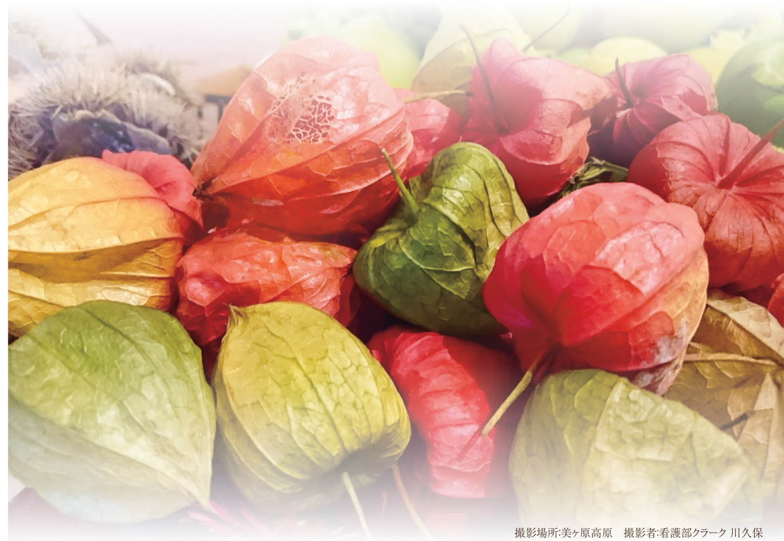
撮影場所:美ヶ原高原