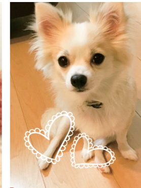
医事課 中野 もこ