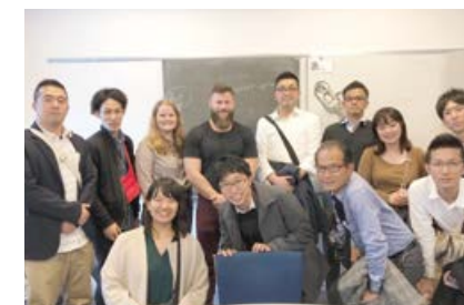
②脳損傷センター (Center for Hjerneskade)