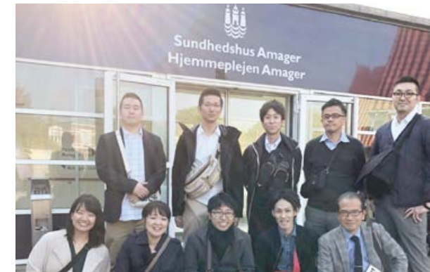
①通所施設 (Training Center Amager)

今回、国も文化も制度も違う中で学んだ事を活かし、患者さんにより良いリハビリテーション医療が提供できるように尽力して参りたいと思います。