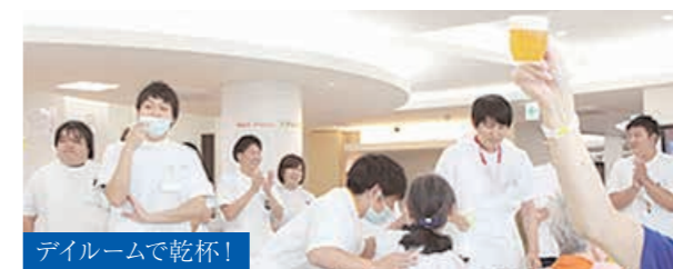
ダイルームで乾杯!