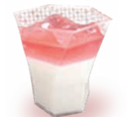
母の日 カーネーションゼリー