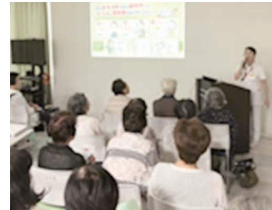
第3回地域健康教室