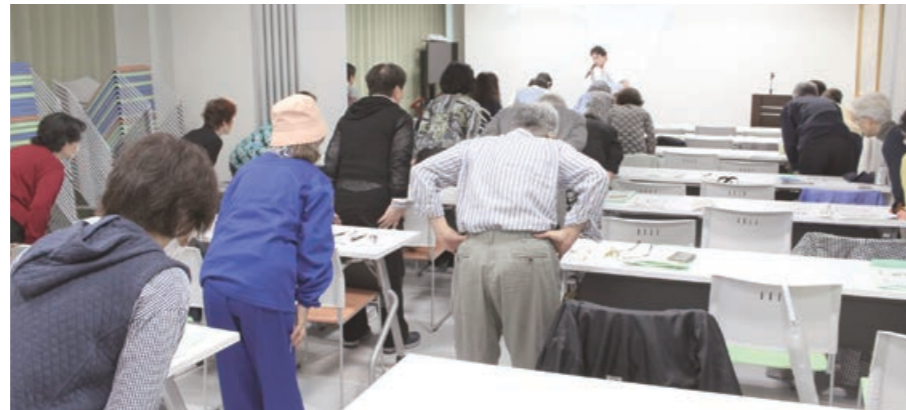
第1回地域健康教室