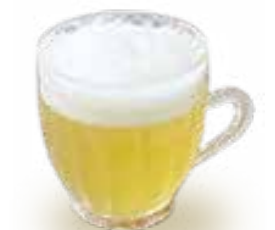
父の日 ビールゼリー