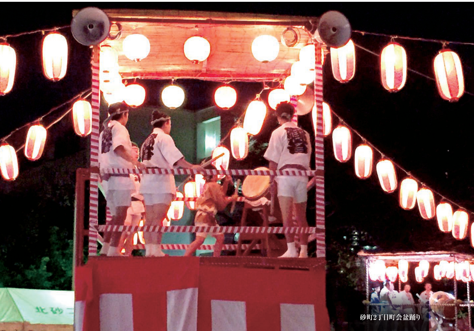
砂町2丁目町会盆踊り