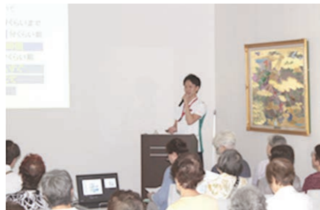
第2回地域健康教室

4月21日(土) 膝の痛みに関して話をさせていただく機会を得ました。膝の痛みは膝にだけ原因があるわけではなく日ごろの姿勢、生活動作が原因となるケースが多くみられます。簡単なストレッチとしてハムストリングスのセルフストレッチを提案させていただきました。ありがとうございました。